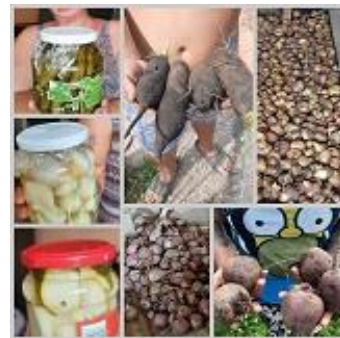
Er werd ook al volop geoogst, ingemaakt en geweekt