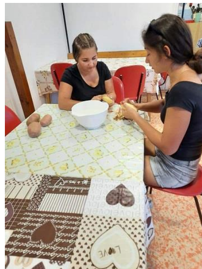
De stoofpot in de bogrács